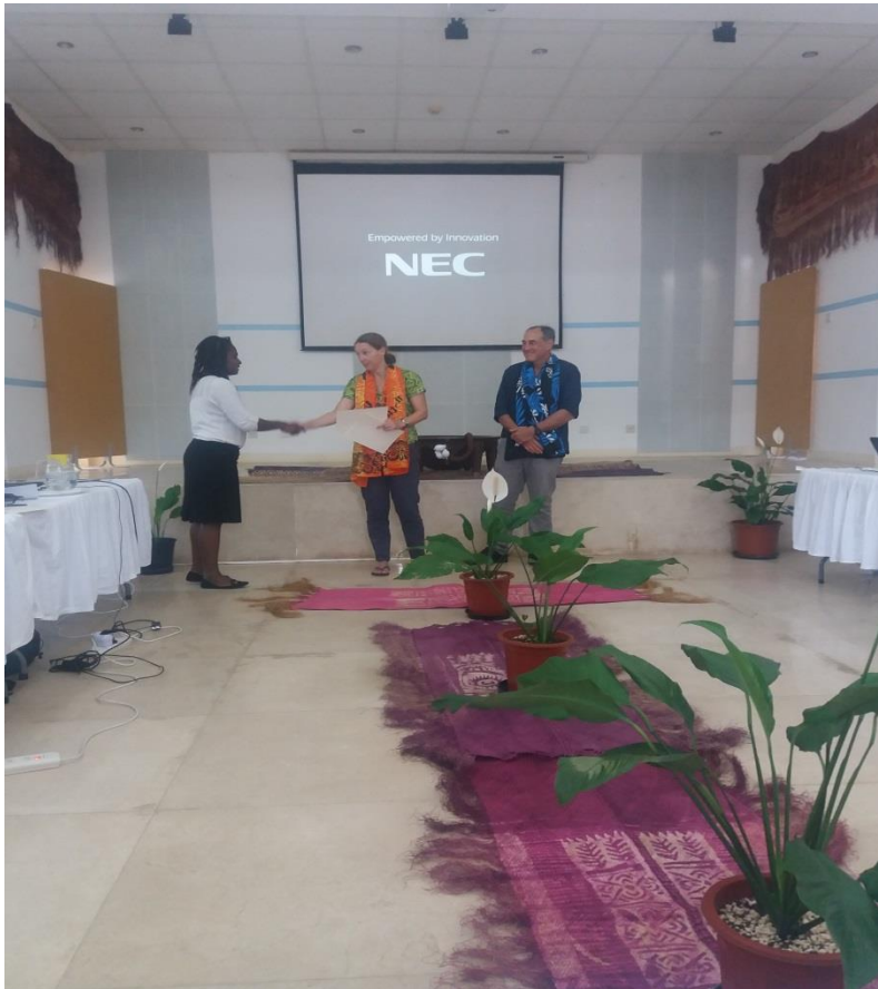
La remise des certificats par les représentant(e)s du CPS après l'atelier du Jeudi après-midi.

L'objectif principal de cet atelier consiste à développer et renforcer les compétences du personnel en analysant les données statistiques, ainsi que d'accroître la capacité du personnel dans la rédaction de rapport. Cela permet généralement d'accentuer le dynamisme du personnel du Ministère de l'Education et de la Formation (MDEF) dans ces domaines afin d'améliorer au maximum niveau de l'Education au Vanuatu.